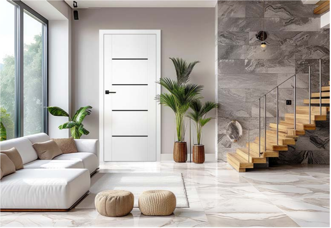
LAURENCJA 1 FEHÉR ST CPL dekorban, fekete VSG üvegezéssel, QUANTA FIT fekete matt kilincssel

BELTÉRI KERETSZERKEZETES STILE AJTÓSZÁRNYAK FALCOS ÉS FALC NÉLKÜLI KIVITELBEN